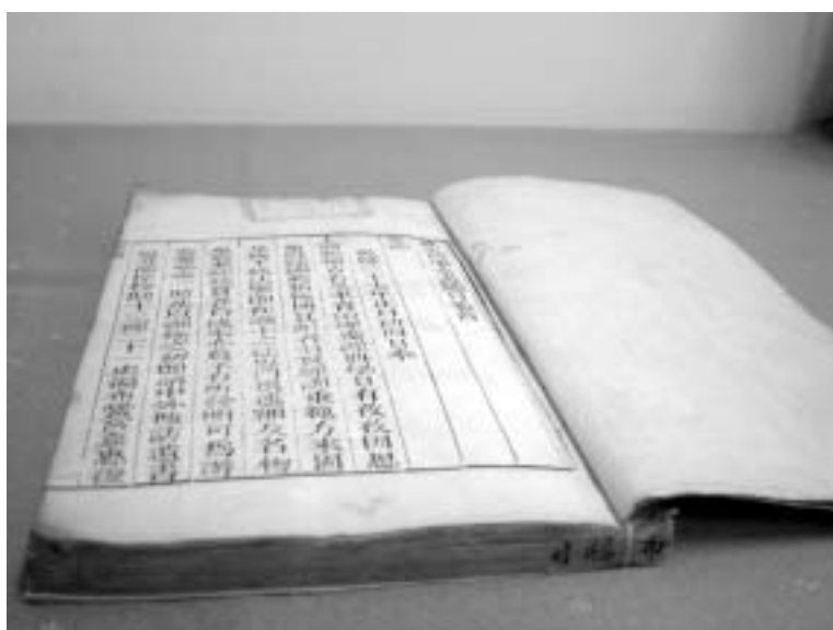
本館珍藏善本書：欽定四庫全書總目

國內外學者研究參考與利用本館特藏資料。該如何妥善完整保存與維護這些資料，避免有價值的人類遺產於現今社會中散失，是現今圖書館與圖書館從業人員責無旁貸而任重道遠的工作，如此才能發揮圖書館保存文化資產的最終目的。（作者為本館典閱組組員）