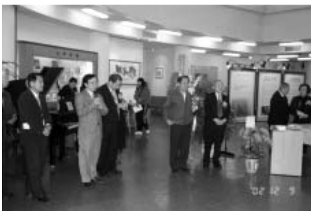
「梁實秋先生百歲誕辰紀念特展」校長致詞

（本講詞係九十一年十二月九日校長於「梁實秋先生百歲誕辰紀念特展」的揭幕講詞，本次活動展出梁實秋先生之手稿、墨寶、著作、打字機、收信章等珍貴資料與物品，展出內容豐富，活動期間吸引各界觀賞，頗受好評。）