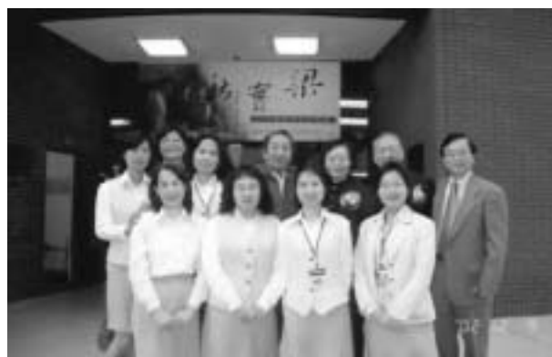
「梁實秋先生百歲誕辰紀念特展」工作人員與貴賓合影