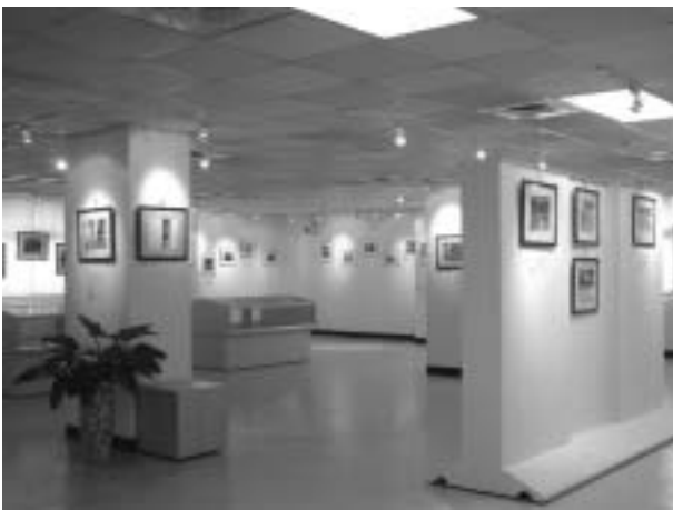
理分館藝文展覽區

【末日—寫作協會第四屆聯展】九十一年十二月九日至十二月十三日於理分館二樓展覽區舉行。寫作協會為本校詩文寫作及創作之學生社團，社員以末日為主題，藉由對都會男