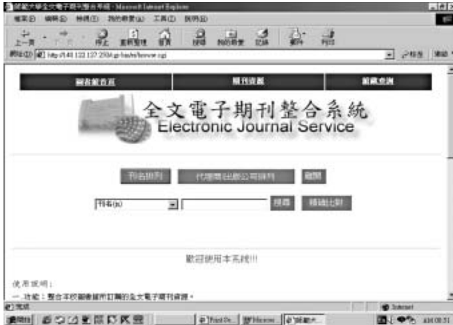
圖 1：「全文電子期刊整合系統」歡迎畫面

為幫助讀者在最短的時間內，從數量龐大、來源不一的全文電子期刊中輕鬆地取得切合所需的期刊文獻，圖書館已於本館網頁上建置完成『全文電子期刊整合系統』數位化服務，透過單一介面，整合不同主題、種類的電子期刊，提供讀者查詢。