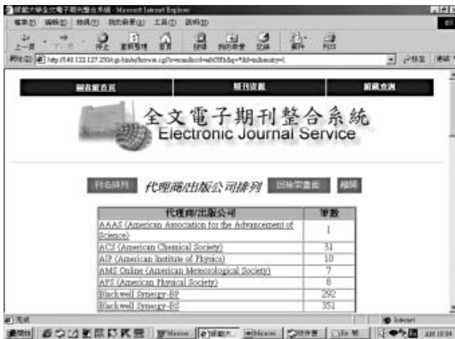
圖 4：代理商/出版公司瀏覽

將收錄電子期刊的來源資料庫或出版社名稱按字母順序排列，並詳列各資料庫期刊筆數。讀者可透過此清單，點選任一資料庫名稱，即可獲取該資料庫所收錄的電子期刊清單，瀏覽查詢所需要的期刊。