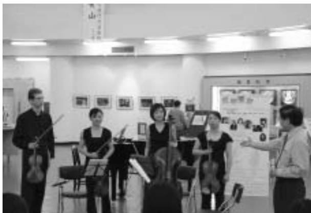
絃樂饗宴——國家交響樂團傑出演奏家蒞館表演