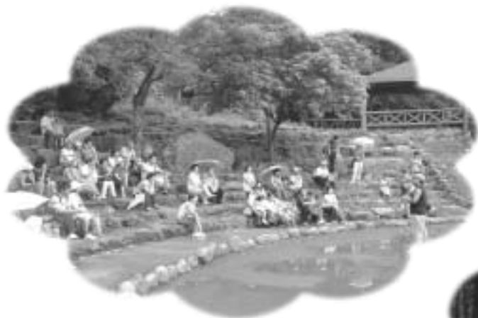
南庄知性之旅—圖書館自強活動

情。十一點多到達南庄，漫步於老街，回味日據時代興建的老郵局。中午在綠色山莊享用豐盛的客家風味餐，餐後在蓬萊客棧展開客家米食教學活動，在兩位校長及館長的領軍下，多位同仁也熱情參與現場的麻糬 DIY，體驗如何將蒸熟的糯米椿成麻糬，然後大夥品嚐自己 DIY 的 QQ 麻糬，也適時避開一陣山區大雷雨。雨過天晴後在解說員帶領下巡禮南庄的生態之美，沿途欣賞結實纍纍的李子樹與挺拔聳立的桂竹林，更瞭解賽夏族與向天湖矮靈祭的由來，在愉快的氣氛中結束難忘的南庄知性之旅。