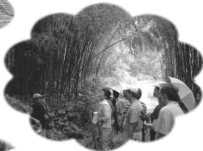
南庄知性之旅—圖書館自強活動