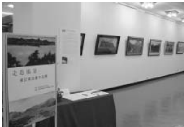
「走進風景」——盧廷清油畫作品展