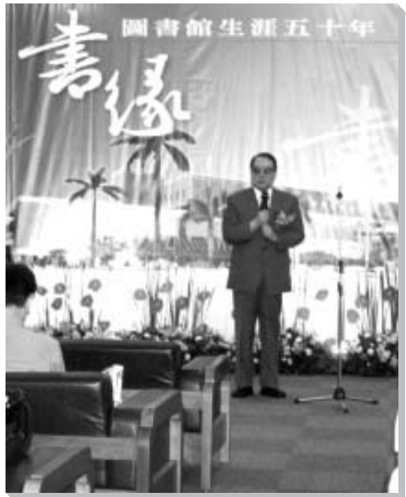
王教授新書發表茶會