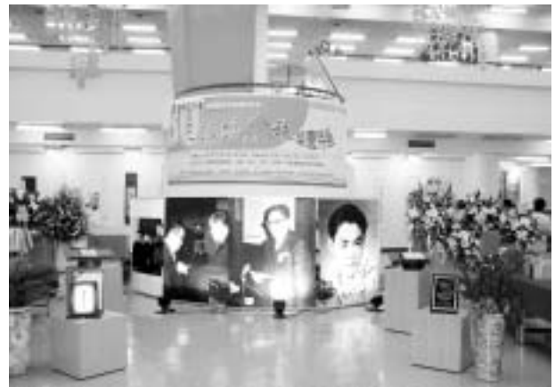
台灣圖書館事業開創者--王振鵠教授八秩榮慶特展

辦「台灣圖書館事業開創者--王振鵠教授八秩榮慶特展」。展出內容，有王振鵠教授著作、書信、照片、影片、珍藏手稿、書畫及相關資料等。王教授曾擔任師大圖書館館長二十餘年及國立中央圖書館館長 12 年，建樹良多。同時在各大專院校圖書資訊學系擔任教職近五十年，造就國內圖書館界無數的菁英。享有「台灣圖書館事業的開創者」、「台灣圖書館界的大家長」、「台灣圖書館界的領航者」、「台灣圖書館界的列車長」、「推動全台圖書館事業的手」等美譽。