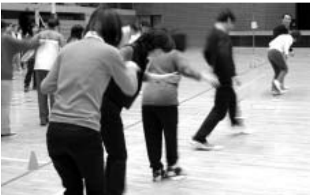
參加「忍者水上飄」同仁

本館同仁參加本年校運（93/11/27）教職員趣味競賽「忍者水上飄」，榮獲第四名。「忍者水上飄」是第一次在校運的趣味競賽中出現，大家都有新鮮感。而大家也擔心與思索，究竟如何才能在最短時間內，完成任務。