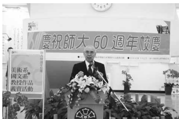
美術系暨國文系教授作品義賣活動——校長致詞