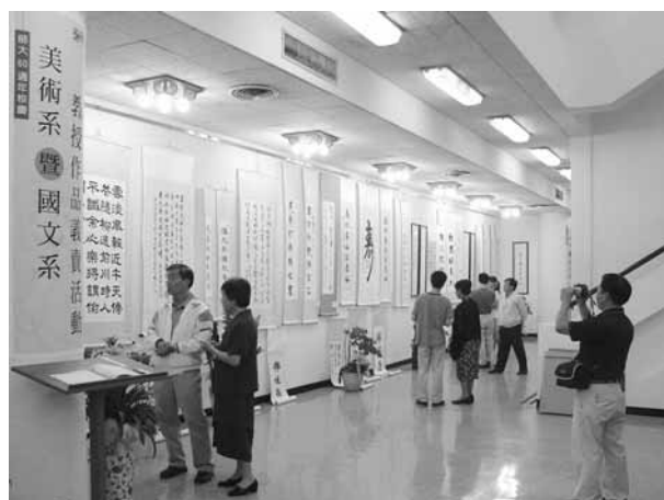
美術系暨國文系教授作品義賣活動