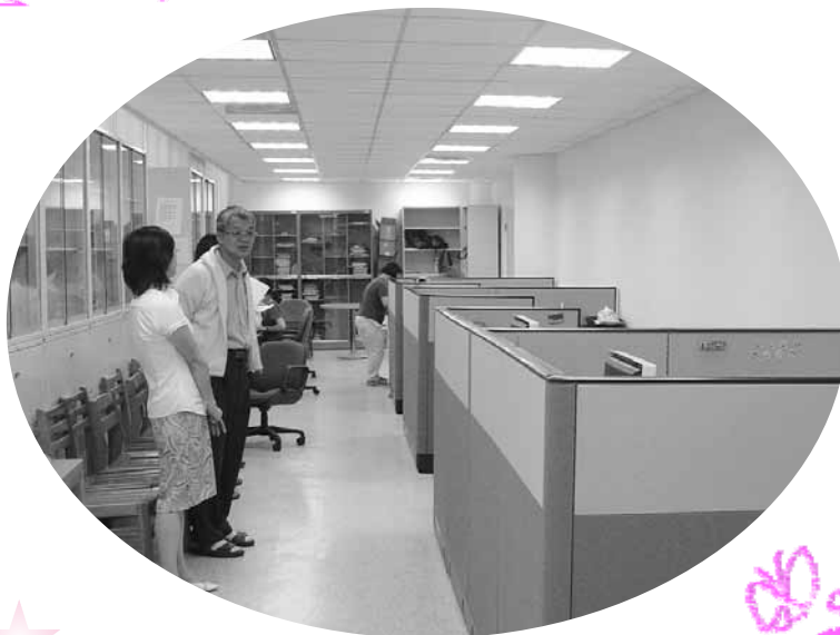
期刊組及推廣組「入新厝」