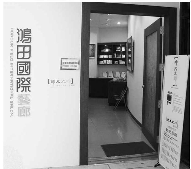
圖書館藝品中心入口

圖書館新成立之藝品中心已於 6 月 3 日校慶活動日開幕，並陸續與本校美術系老師完成授權，將師大美術系老師作品以複製畫或衍生品方式製作銷售，希望打響「師大大師」的品牌，這些具師大特色的商品亦是餽贈親友佳賓的最佳禮品。目前以 BOT 方式與廠商合作，除圖書館 1 樓的藝品中心外，更希望增加銷售據點（如誠品書店）。