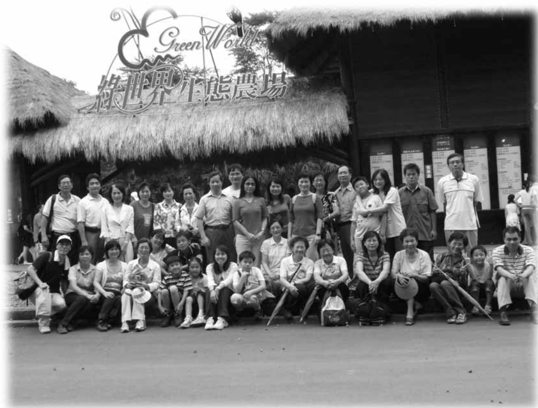
本館自強活動——綠世界生態農場一日遊留影