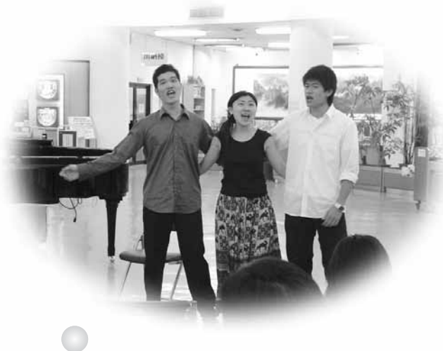
午間音樂饗宴——音樂劇選粹