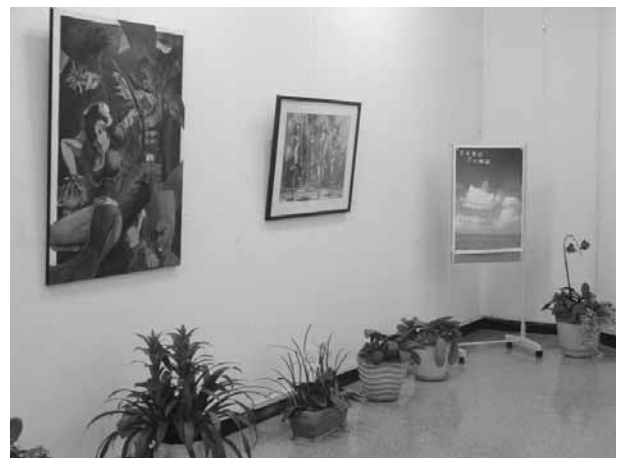
炎炎夏日 三人聯展