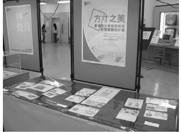
方寸之美——台灣師大美術系校友郵票繪圖設計展